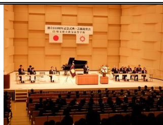
創立110周年記念式典 (平成29年)