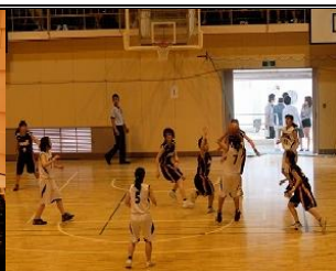
女子バスケットボール部